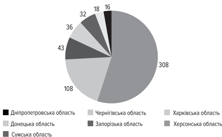
Напади та вбивства цивільного населення України

Демографічний склад жертв нападів та вбивств цивільного населення.