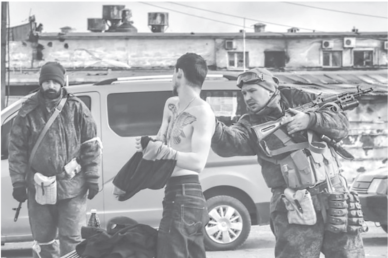
Російські військові перевіряють чоловіка на одному з блокпостів.

Фільтрація відбувається у два етапи. На першому етапі весь потік біженців має пройти перевірку документів, взяття відбитків пальців та первинне опитування на так званих фільтраційних пунктах. Цей етап може тривати від кількох годин до кількох днів, залежно від довжини черги до фільтраційного пункту. Велика увага при цьому звертається на чо-