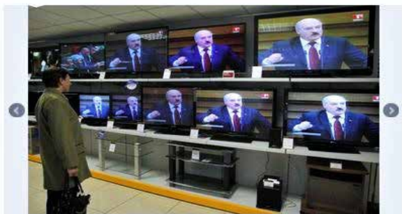
Diktator. Sverige kan anmäla Belarus för dess vägran att respektera människorättskommitténs beslut, skriver Martin Uggla.

SENASTE NYTT 10:21 Osthämmer pantar mest i länet | 10:17 Fuskanklagad student stängdes av | 10:00 Serbien och EU in