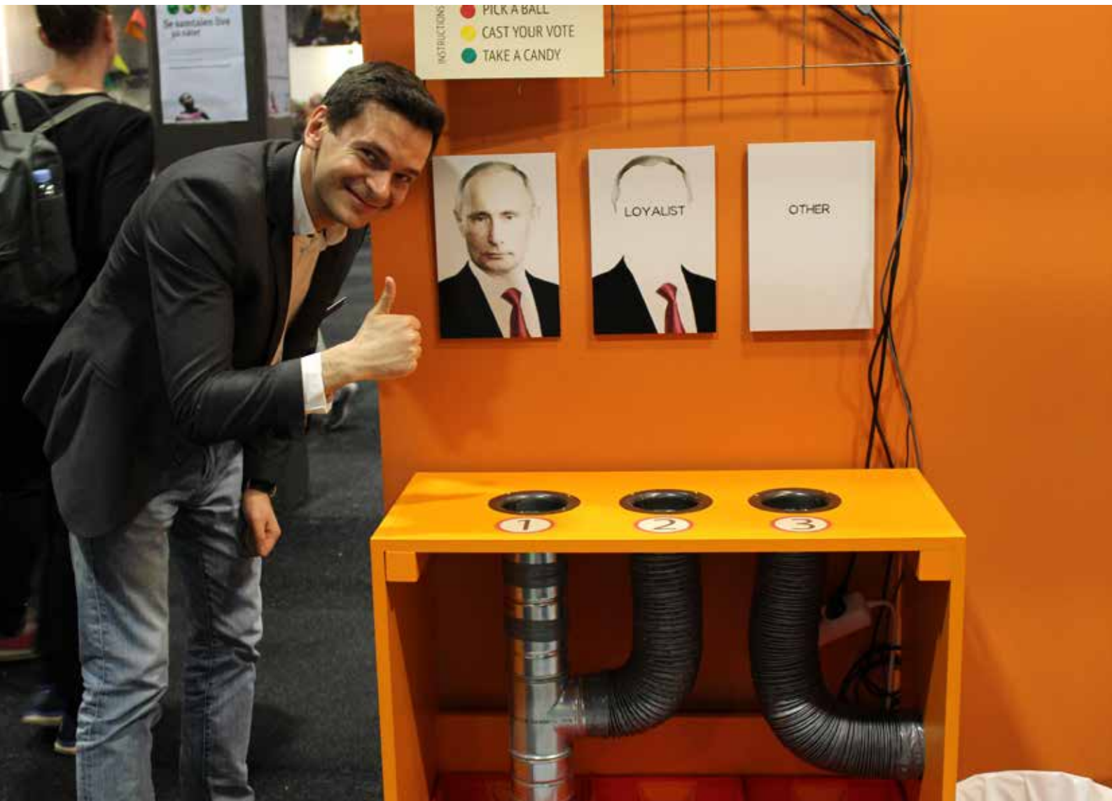
Ilja Jasjin gör tummen upp för Östgruppens röstomat!

Vi samtalade därutöver med besökare i vår monter. Många gjorde dessutom det personlighetstest som vi utformat för Bokmässans gäster, med hjälp av vilket vi med glimten i ögat avgjorde om personerna ifråga löpte risk att bli till ”troll” i propagandans tjänst. Vår ”Röstomat” drog också till sig förbipasserandes uppmärksamhet. Den illustrerade valfusket i Ryssland och Belarus genom att ställa besökaren inför tre valmöjligheter men endast möjliggöra en röst på det ”rätta” alternativet. Många fotograferade och delade röstomaten. Ilja Jasjin spelade in en video som illustrerade hur Röstomaten fungerar och lade upp på sociala medier. Klippet blev snabbt viralt, delades av många personer och fick mängder av positiva kommentarer. Fler än 20 000 personer såg klippet och flera internationella nyhetsmedier plockade upp tråden och publicerade notiser om att man på Bokmässan i Göteborg placerat en installation som drev med valen i Ryssland.