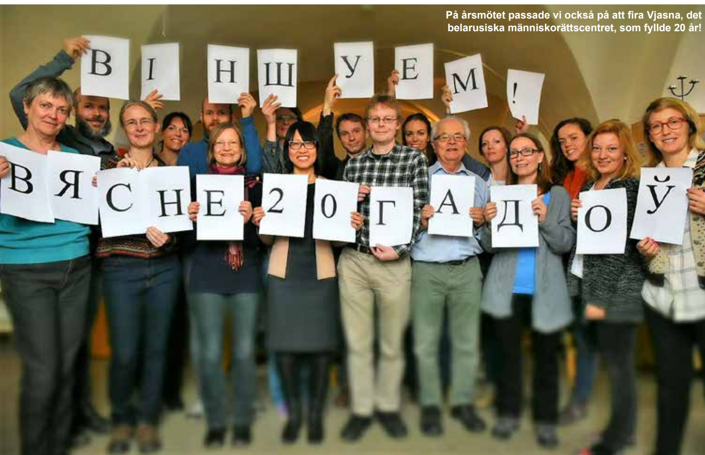
På årsmötet passade vi också på att fira Vjasna, det belarusiska människorättscentret, som fyllde 20 år!

Därefter serverades georgisk lunchmat, varpå den estländsk-georgiska filmen Mandarinodlaren visades för årsmötesdeltagarna.