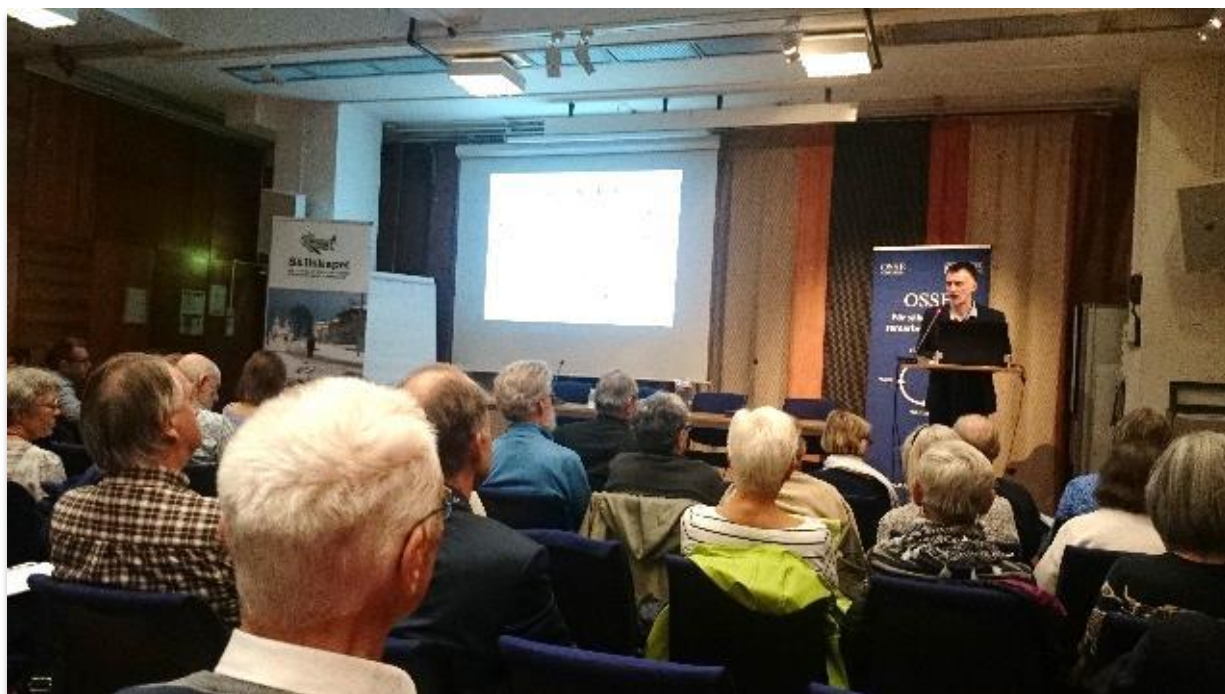
Bild från kvällsseminariet på ABF.