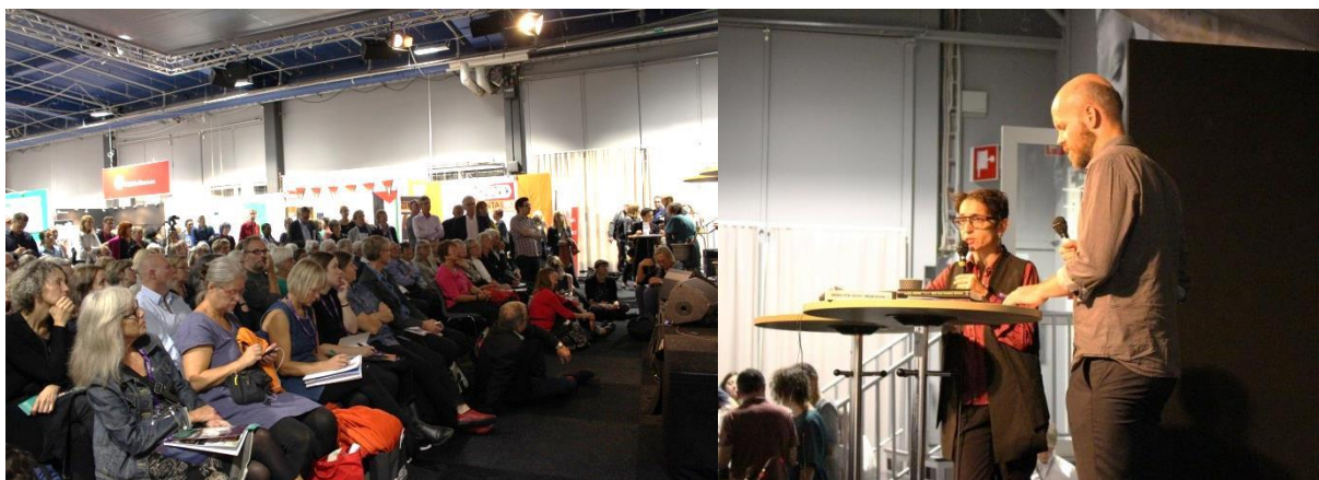
Det kom mycket folk till seminariet med Masha Gessen!