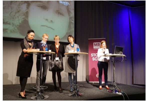
Talarna på seminariet "Går det att demokratisera diktaturerna i Öst?"

I vår monter och i seminarielokalerna delade vi ut Östgruppens skrift om föreningsfrihet i Ryssland och vår senaste rapport "Rysslands sak är vår" samt erbjöd alla som besökte vår monter att testa en quiz om MR-frågor och en quiz med rubriken "Tidning från Sovjet eller Ryssland". Östgruppen arrangerade båda seminarierna med hjälp av Polska Institutet.