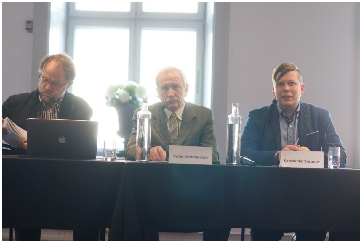
Bild från heldagsseminariet på Kungliga Myntkabinettet.

an hälften av dessa var från Belarus. Medintresset för landet var som väntat lågt, där fokus fortsatt låg på den mer dramatiska utvecklingen i andra av regionens