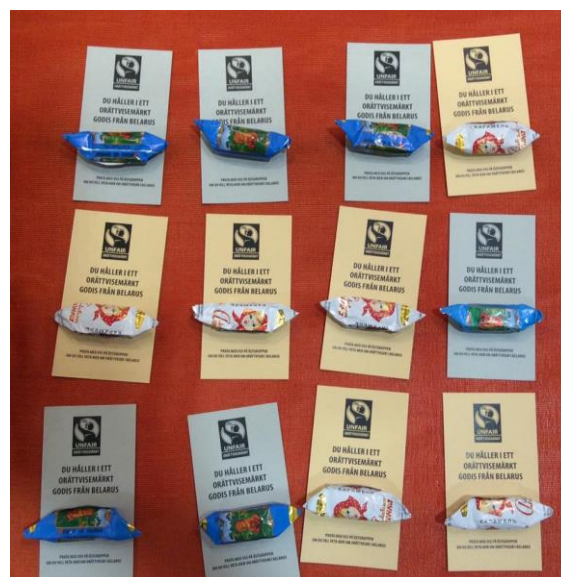
Orättvisemärkt godis från Belarus som vi delade ut till besökarna.