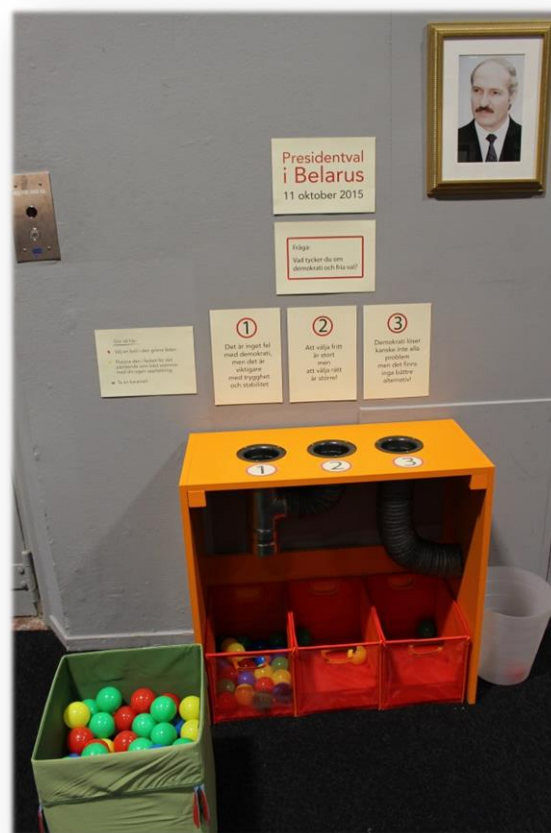
Bild på Röstomaten.

Den andra delen av vår monter, med vilken vi avsåg sätta fokus på presidentvalet i Belarus centrerades kring vår "Röstomat" – en sorts installation över valfusk som vi byggde till mässan. I Röstomaten kan man välja att lägga sin röst på ett av tre alternativ, genom att placera en boll i ett av tre hål. Bollen passerar därefter genom ett rörsystem som gör att en röst på alternativ två i praktiken blir en röst på alternativ ett, medan en röst på alternativ tre leder ut bollen till en papperskorg bredvid Röstomaten. Beträktad på lite avstånd ser man hur Röstomatens rörsystem fungerar. Konstruktionen blev mycket uppskattad. Under helgen då presidentvalet hölls i Belarus lades en bild på Röstomaten upp på Twitter, som snabbt blev viral i Belarus.