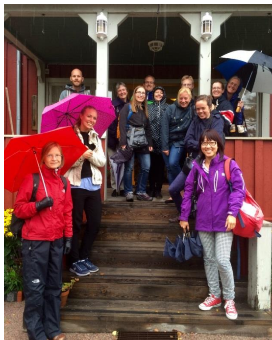
Personal och styrelse på väg hem från ett regnigt Breidagård.